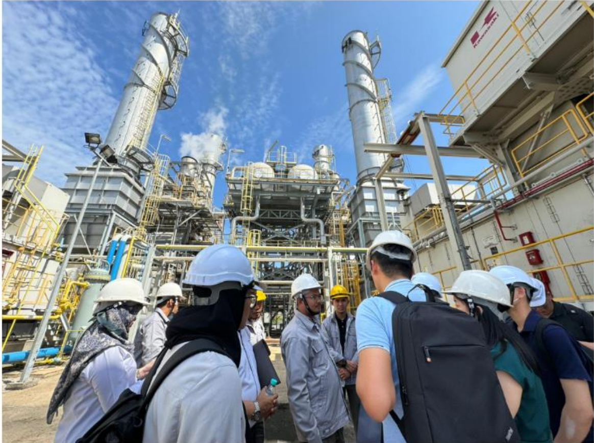
Loji CHP Gas Malaysia di Peral.